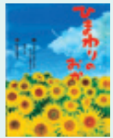
ひまわりをうえた八人のおかあさんと 葉方 丹/著

二〇一二年三月十一日。 宮城県石巻市大川小学校を、大きな津波がおそいました。わが子を亡くしたお母さんたちは、やがて小学校のそばにたくさのひまわりを植えはじめました。植物の水は、やりすぎると根っこが育たなくなりす。でも、お母さんたちは言いました。「いいよ、あまやかそう。飲みたがってるんだもん、たくさんあげようよ。もう我慢しなくていいよ。」一粒の小さな種に、わが子の生きてきた証を求めて…それが一冊の絵本となり、やがて生ぎる支えになったに違いありません。 (島田 博子)