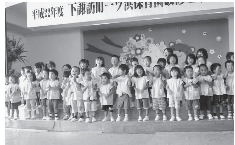
完成を喜び元気に歌う園児たち

平成2年4月開園した一ツ浜保育園は築20年が経過し、老朽化による劣化が進み、また3園態勢における各保育園施設の平準化、保育環境の向上を目指し改修工事を行いました。