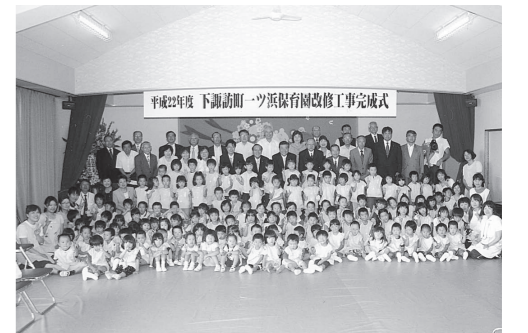
全員で記念写真を撮影