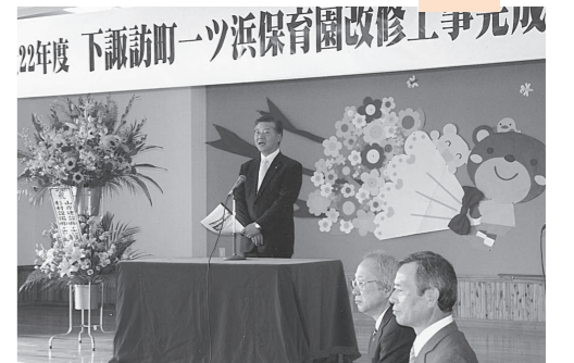
改修を祝い完成式