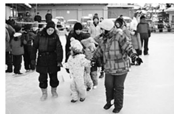
フリースケートリンク