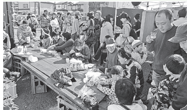
大勢の人で賑わう 御湖鶴 秋の蔵まつり

次回「ぶらりしもすわ三角八丁!其の二十五」の開催につきましても、決定次第情報を発信いたします。今後ともどうぞよろしくお願いたします!