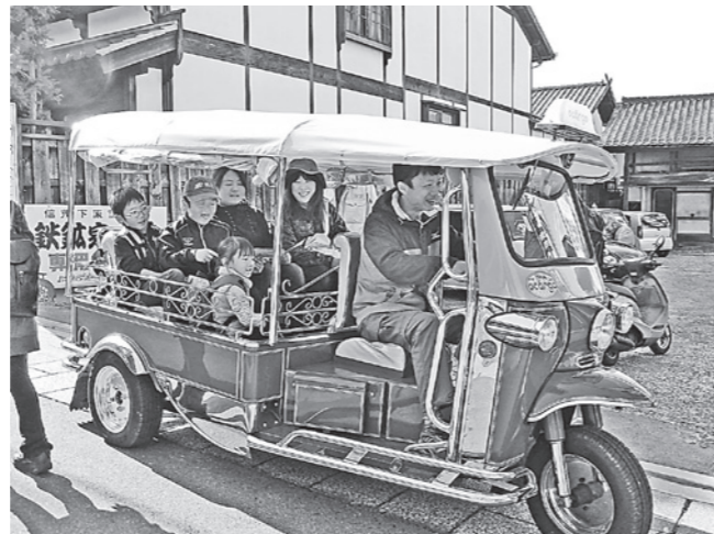
オカーゴ乗車体験