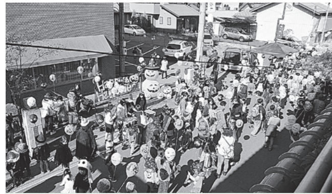
ハロウィーンパレード 大行列

平成16年に始まったまち歩きイベント「～ぶらりしもすわ～三角八丁(さんかくばっちょう)」。24回目を迎えた今回も、様々な個性あふれる団体による”もりだくさん”のイベントが下諏訪の町を彩りました。