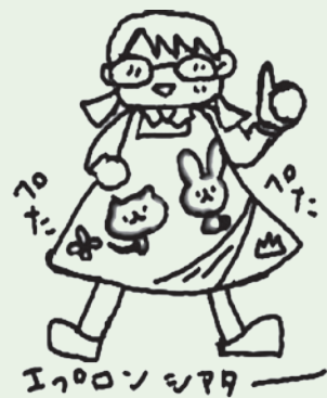
エプロンシアター