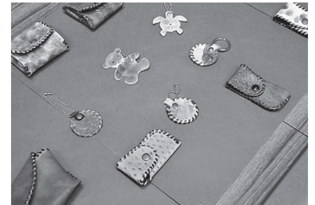
花田養護学校（陶芸・手工芸品）