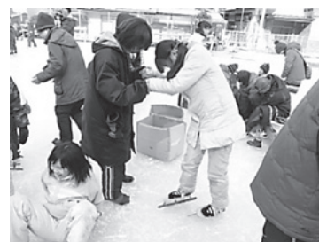
下駄スケート体験