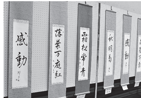
高齢者クラブ連合会 書道部（縦書掛軸）