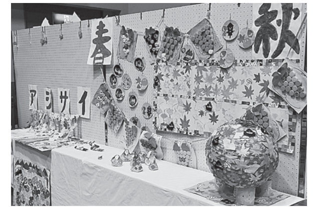
ディサービスセンタースマイル（手芸・工作）