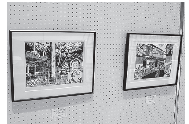
下諏訪版画友の会（版画）