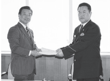
H24.12.26 諏訪警察署と「下諏訪町の事務事業等からの暴力団排除の措置を講ずるための合意書」を締結しました