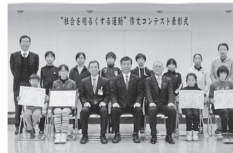
《小学生の部 入選者》