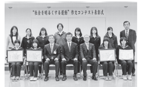
《中学生の部 入選者》

1月28日に町入選の20点と合わせて受賞者の表彰式が行われました。受賞者のみなさんをご紹介します。