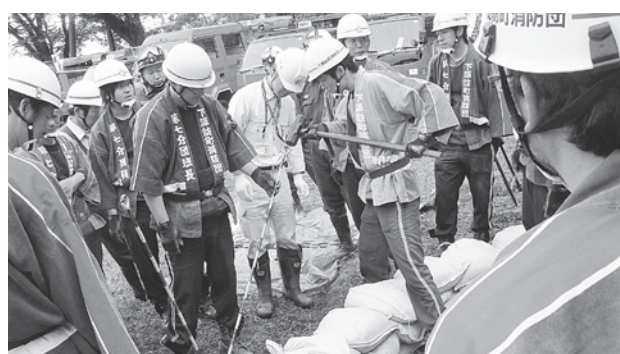
下諏訪町水防訓練