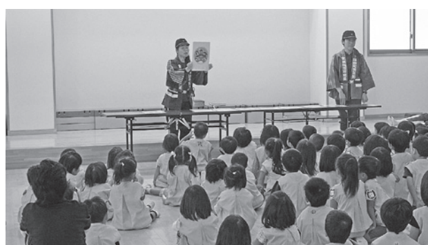
女性消防隊・保育園防災教室