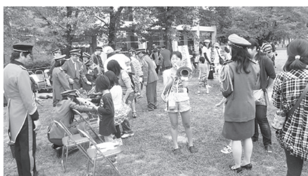
消防ふれあいひろば