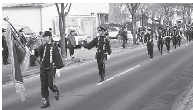
消防出初式分列行進