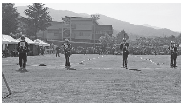
ポンプ操法・ラッパ吹奏大会