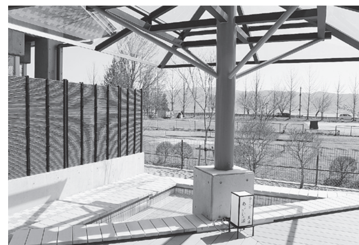
←あじさいの湯(足湯)