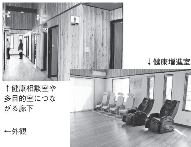
↑健康相談室や多目的室につながる廊下