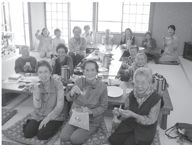
湖畔の湯ふれあい・いきいきサロン