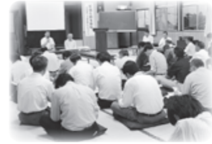
平成23年度 町長と語る会の様子