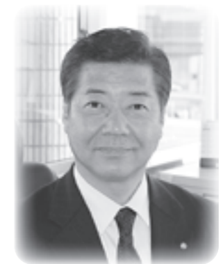
下諏訪町長 青木 悟