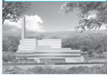
完成予想図(イメージ図)

ecoポッポの性能や設備などを知っていただき、皆さまの生活に欠かせない施設を身近に感じていただくとともに、工事スケジュールや工事期間中の安全対策(工事用車両の通行形態や周辺環境への配慮)などをお知らせするため説明会を開催しますので、多くの皆さまのご参加をお待ちしています。