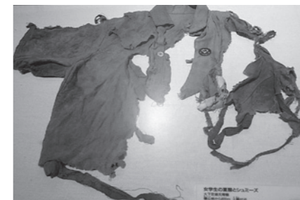
夏服を身につけた少女は大火傷を負い、亡くなりました