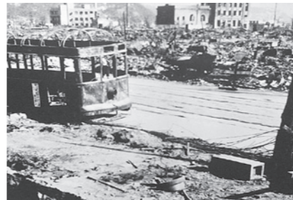
爆心地から310mの基町の惨状