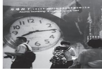
原爆投下の時刻のまま止まった時計