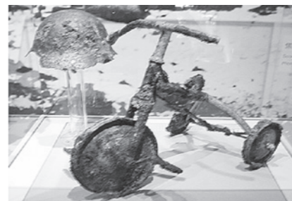
三輪車に乗っていた男の子の命も奪いました