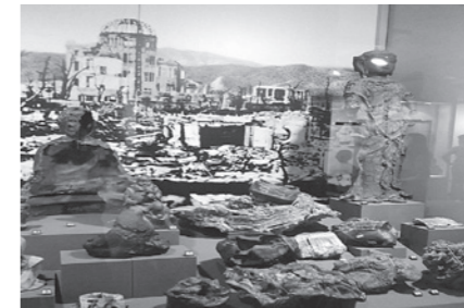
仏像などあらゆるものを溶かしました