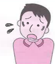
(消費者庁イラスト集より)