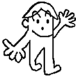
下諏訪町国保キャラクター さかみちのぼる

年金・医療の分野では、国民年金や国保・後期高齢者医療の手続きで、マイナンバーと本人確認書類の提示をお願いしているよ！ 問住民環境課 国保年金係（内線137・140）