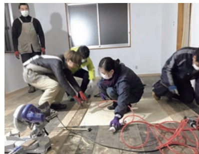
1月のリノベーションツアーの様子