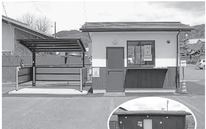
平成30年度 に整備のトイレ

また、新たに観光パンフレットなどを設置するスペースを設け、レンタサイクルなどで町内を巡る方々への観光案内も行われます。