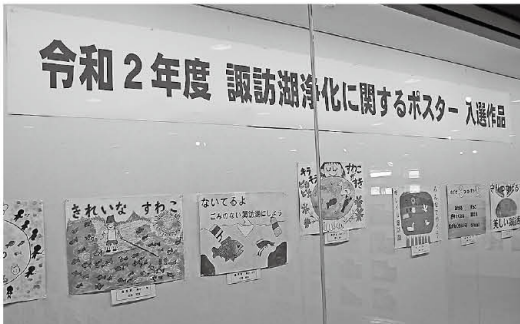
【諏訪湖浄化に関するポスター入選作品】