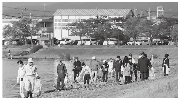
ヒシの繁茂により、打ち上げられたヒシを手作業で回収していました。