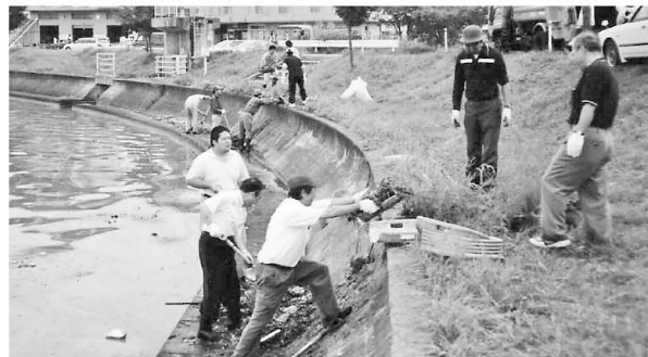
湖面のごみをコンクリート護岸からスコップなどを使って引き上げていました。