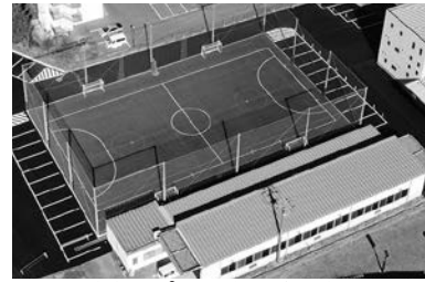
健康スポーツ施設整備事業 (健康フィールド)