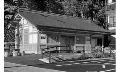
春宮公衆トイレ建設事業