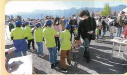
警察署主催のふれあいコンサート会場において少年部員による啓発活動を実施した。