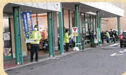
管内の商業店舗前で交通事故防止を目的とした啓発活動(サンセット作戦)を実施した。