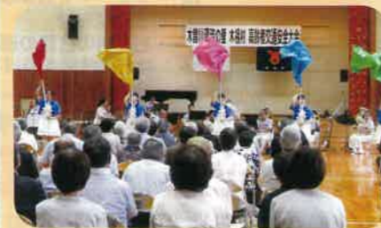
管内の小学校体育館において「高齢者交通安全大会」を開催した。