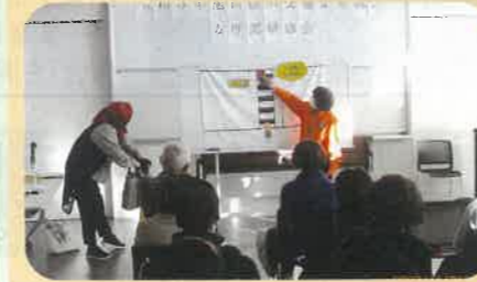
管内の公共施設において女性部研修会を実施した。