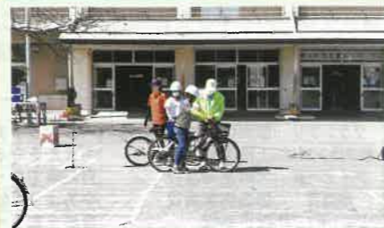
市内の小学校の交通安全教室において、児童に自転車の正しい乗り方について指導した。