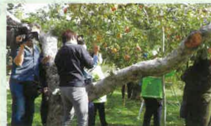
交通安全活動の一環として関係機関に配布する「交通安全リンゴ」のシール貼りを行った。