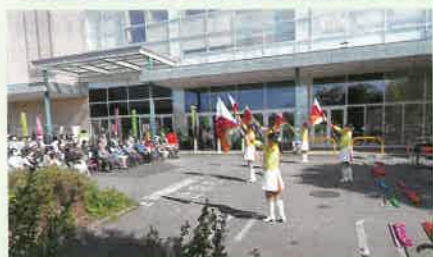
管内の商業店舗で県警音楽隊の演奏等を含めた交通安全イベントを実施した。

交通安全協会は、交通事故をなくすため、様々な活動を行っています。活動の一例を紹介します。