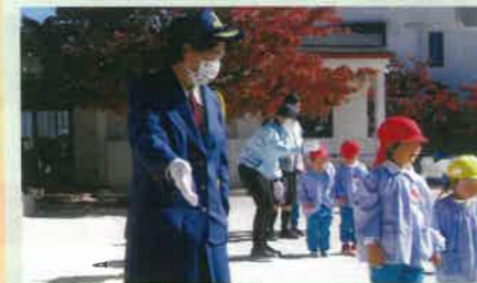
市内の幼稚園において女性部と市の交通安全教育担当で交通安全教室を実施した。