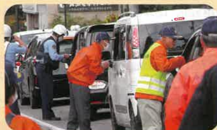
管内の主要交差点において交通事故防止啓発活動を実施した。