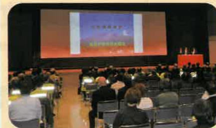
「交通安全協会長野県大会」において活動事例を発表した。