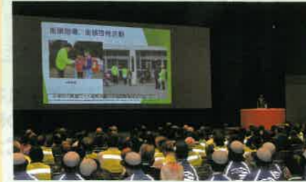
「交通安全協会長野県大会」において活動事例を発表した。