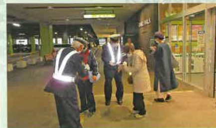
夜間における交通事故防止啓発活動として、管内の大型商業施設においてサンセット作戦を実施した。