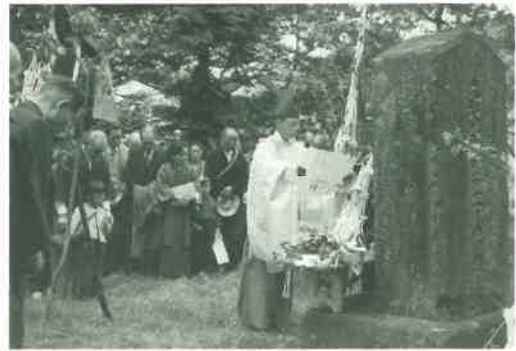
浪人塚90年祭の様子