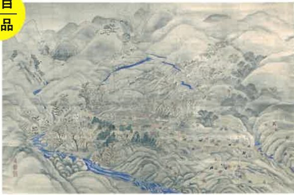
岩波其残『和田嶺合戦図』(辰野美術館所蔵)