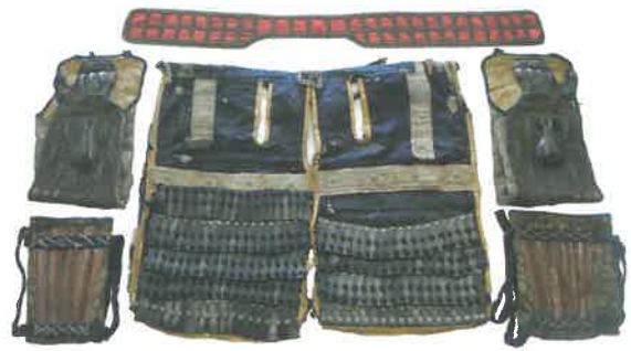
水戸浪士が合戦で使用した具足(当館寄託資料)