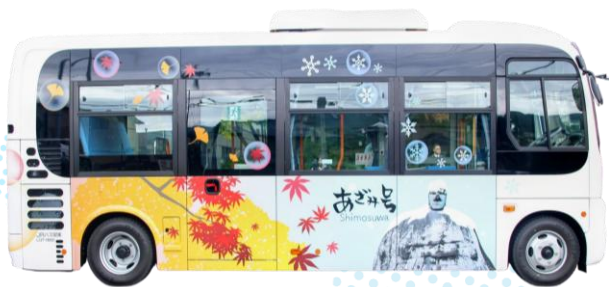
下諏訪町循環バス「あざみ号」