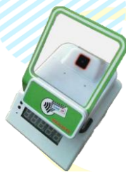
キャッシュレス決済機 TicketQR