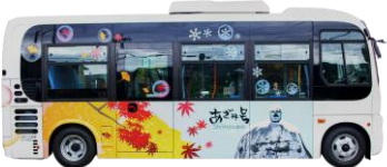
マイクロバス(31人乗り) 萩倉・星が丘線、武居線第3～8便