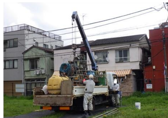
クレーン付きトラックによる機材搬入の例