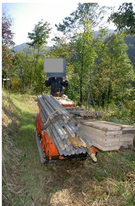
運搬車による機材搬入の例