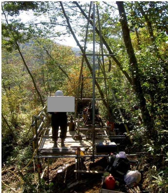
ボーリング作業の例