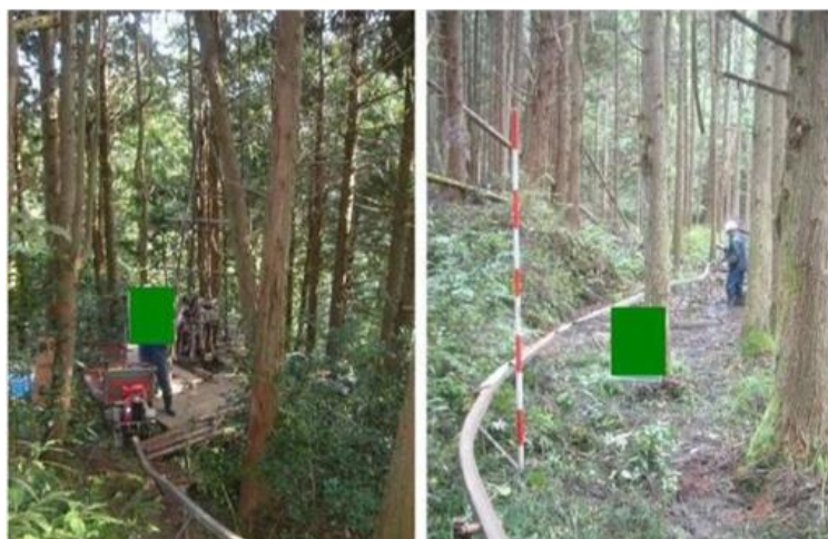
モノレールによる機材搬入の例