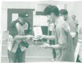
信州プリリアントアリーズ