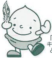
「緑の募金」 キャラクター どんぐり君

各地区での身近な緑化活動や、 森林ボランティア団体等を対象とする公募事業、 みどりの少年団の育成などに活用しています。