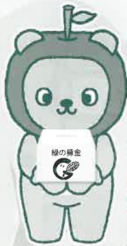
長野県PRキャラクター 「アルクマ」