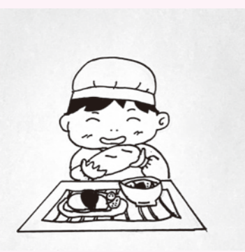
全国に広がる給食費完全無償化

られないケースへの対応は、教育子ども課長 議論できていない。保護者の意見を聞いていく。 学童クラブ支援員配置 問 学童クラブへの地域おこし協力隊員2人の採用に伴う、支援員配置に変化は。 答 教育子ども課長 隊員には代表支援員を兼務いただく。引き継ぎも含め、現在の代表支援員の方には、支援員として残っていただく。