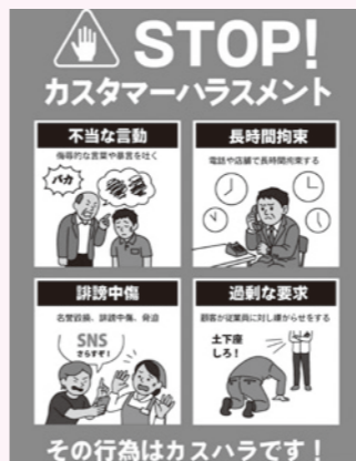
ストップカスハラ

明文化したガイドラインや簡易マニュアル作成の考えは。 総務課長 新入職員や若手職員が線引きに迷うこともあると思う。前向きに取り組んでいく。 問 庁舎内にクレームとカスハラの違いが分かる掲示物を掲示してほしいが、その考えは。 総務課長 組織的に対応することは重要。事業者の義務として対応が必要であるため、R8年度中に指針を整備し運用方法を検討する。