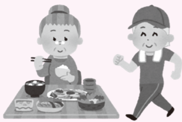
食事と運動でフレイル予防を

町長 共存共栄の関係を築くことで地域全体の活性化につなげていきたい。共同で開催するイベントなどを通して地域の活性化を図ることも一つの施策として考えていく。