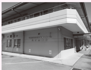
繰入金増加の「ハイム天白」

問 消防団員の福祉向上を図り、参加したくなる消防団を目指さなければいけない。施策は。消防課長 ライフスタイルの多様化に対応した機能別消防団員制度の活用や、女性が活動しやすい環境整備にも取り組んでいる。