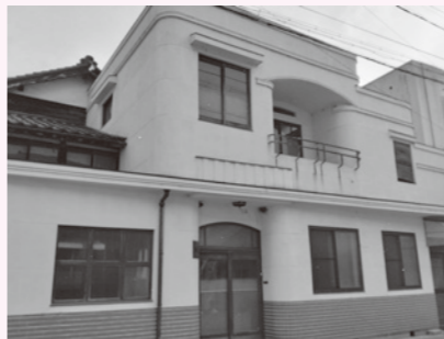
改修予定の旧矢崎商店

問 商工会議所で生成AI(人工知能)の活用講座等も実施されているが、庁舎内外での活用にどのような期待をしているか。また、生成AI活用のための町職員に向けた伴走型支援をどう取り入れているのか。