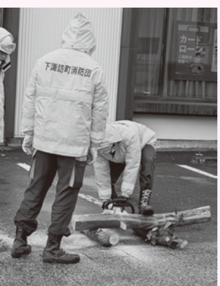
チェンソー使用訓練をする団員

問 八島高原トイレについて。簡易トイレ設置はできないか。産業振興課長 凍結、清掃、防犯など課題もある。必要性があるか検討する。