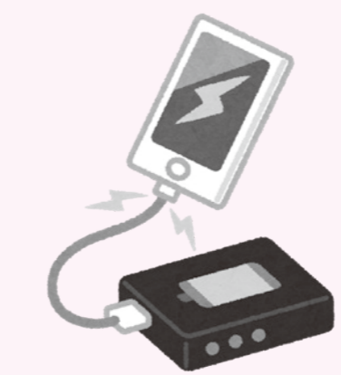
リチウムイオン電池の発火事故防止

問 学校給食費の負担軽減。小学校給食費を月額5200円まで国が支援するが、不登校や重度のアレルギー等により給食を利用しない児童に対し、公平性の観点から国の支援相当額を現金給付出来ないか。教育こども課長 国の動向など今後の見通しを注視しながら持続可能な支援を模索したい。