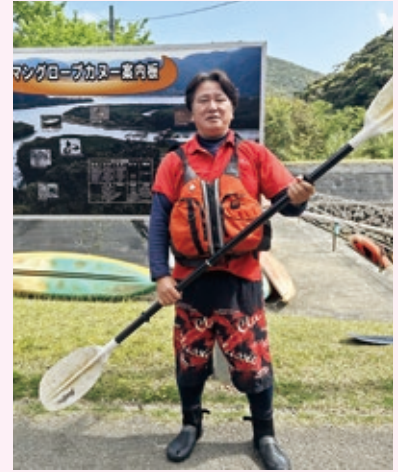
下諏訪町から移住し、奄美大島マングローブパークでカヌーのガイドをしています。

奄美に移住してから感じるのは、当たり前にあった温泉はなく、雪景色などを見る事ができず羨ましく思います。同町は、お互いにならないものや共通点が多々あり、製糸業と大島紬の生糸繋がりなどあります。今回のきっかけで、色んな方々が交流して行く事を願っています。