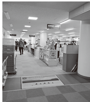
総合政策課を新設

「総合政策課」を新設。課内に「企画創生係」「地域戦略係」を新設し、総務課「デジタル推進室」を移管。税務課と会計課を統合し、「財務会計課」を新設。合理的な統合であり、戦略的且つ機動的な対応が期待されます。 また、教育こども課内に、国民スポーツ大会の開催準備を担当する「国スポ推進室」が新設されます。