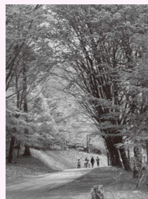
みんなに愛されるいずみ湖公園に

問 いずみ湖公園の今後の活用は。町長 供用開始から30年経過し、施設も老朽化してきている。特有の自然環境を活かす中で、大規模改修は難しいが、現在研究中。問 魅力化に向けた進捗状況は。