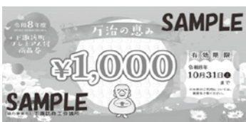
プレミアム付商品券

衆議院議員総選挙の執行に伴い、投票所の設営や入場券の発送、開票事務などに必要な経費として1144万円が追加されました。財源は全額国からです。選挙を適正かつ円滑に実施するための補正が専決処分され、承認しました。