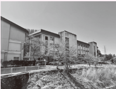
地域でかけがえのない下諏訪向陽高校