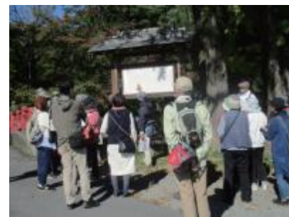
下諏訪町デジタルアルバムでまちづくり講座