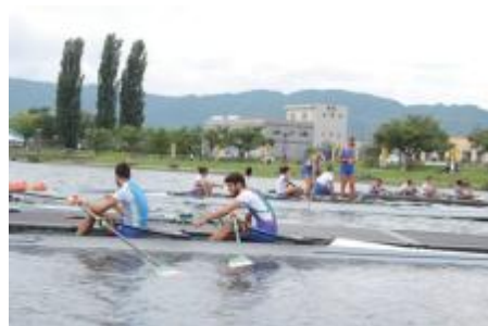
東京2020オリンピック事前合宿の様子