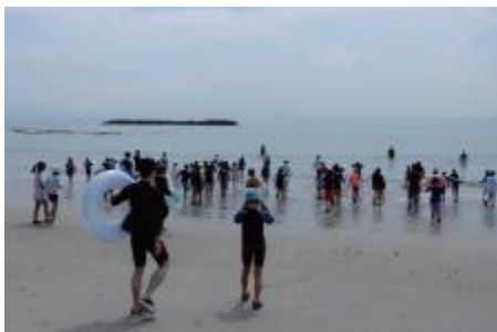
姉妹都市交流事業(愛知県南知多町)