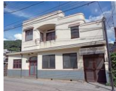
国登録有形文化財「旧矢崎商店」