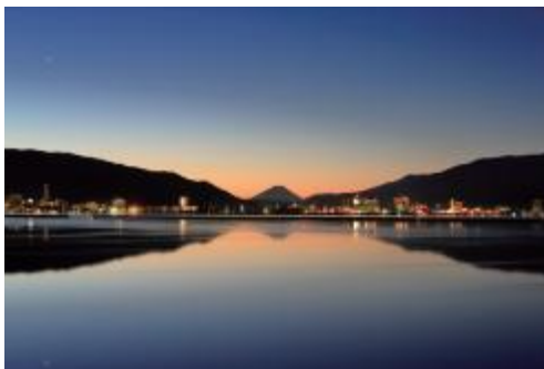
湖畔から望む富士山