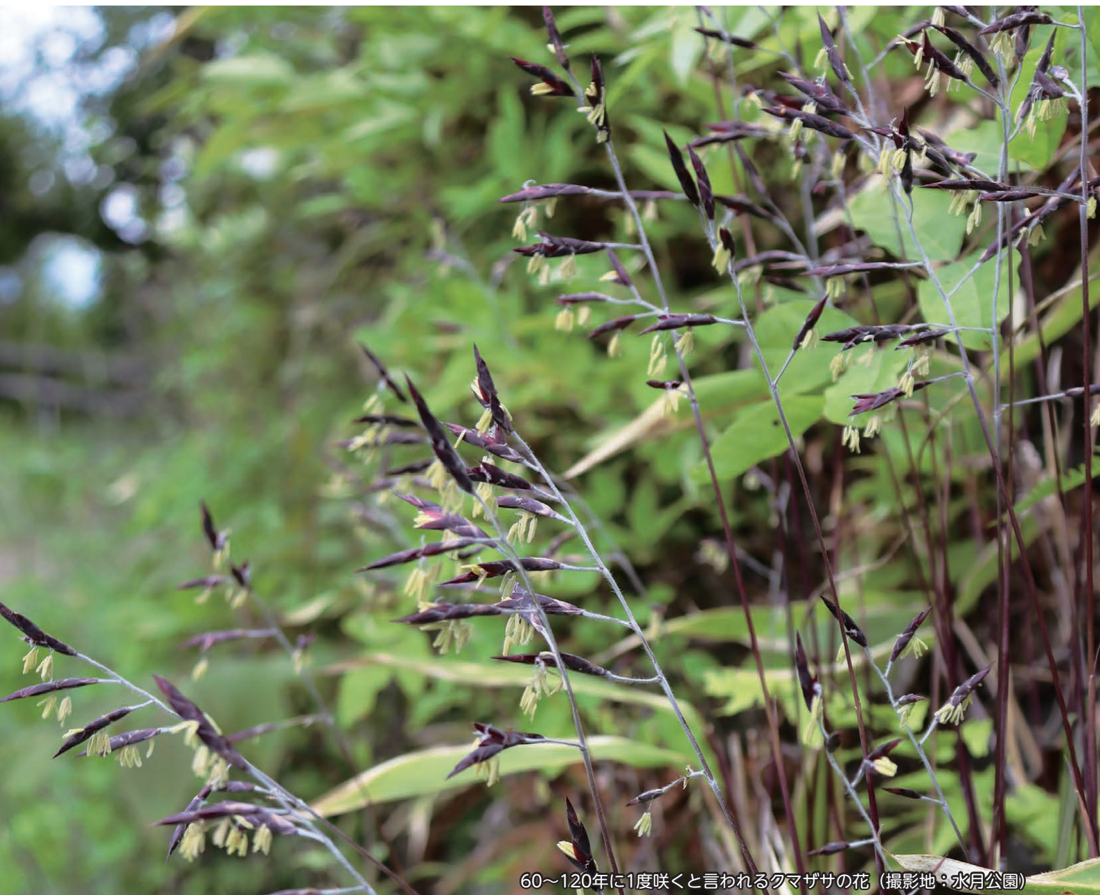
60~120年に1度咲くと言われるクマザサの花 (撮影地:水月公園)