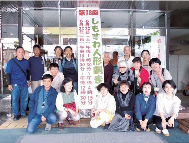
実行委員のメンバー

2025年には、日本で唯一の者（耳が聞こえない人）と聴者（聞こえる人）が協力して公演活動を行っているプロの人形劇団「デフ・パペットシアター・ひとみ」（神奈川県）の人形劇『一寸法師』を呼ぶなど文化的にも質の高い人形劇まつりになっています。