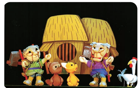
『金のおの銀のおの』