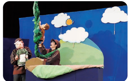
『ジャックとまめの木』