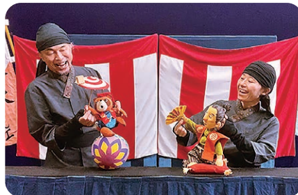
『ぶんぶくちやがま』